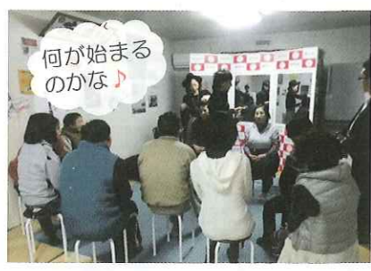
何が始まるのかな かたわくわくした雰囲気伝わってきました。

特別な道具を使わず、あつという間にその人に似合った髪形をつくりだす。まさに、職人の技★普段、美容室や床屋に行くと、鏡に映る自分と向き合うだけ…でも、今回はひと味違います!