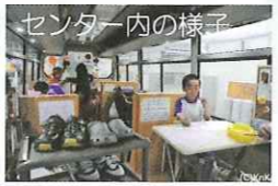
センター内の様子

「走る・KPKK子どもセンター」ってご存知ですか? 認定NPO法人 国境なき子どもたち(KPKK)が運営する「子どもたちの居場所づくり」を目的とした移動型の子どものセンター(改造バス)のことです。放課後、子どもたち(小中学生)がこのバスに集まり、勉強や読書・友だちとゆっくり話をするなど、さまざまな目的で利用しています。 今回、KPKKより「センターを利用する子どもたちと地域のみなさんが交流できる機会を!」という話を受け、当会もお手伝いさせて頂きました。