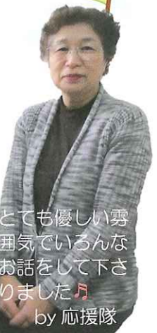
とても優しい雰囲気でお話を下さりました。by 応援隊

【編集後記】 2015年、スタートして早1ヶ月。雪が降り、厳しい寒さが続きます。今回は、以前にご案内した助成金を改めてご紹介★助成金は、各地から寄せられた人の優しさで出来ています。優しさの輪が広がる活動が増えますように:)