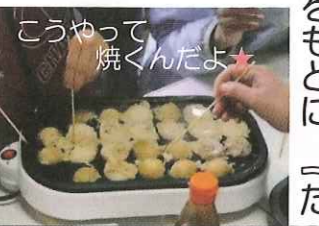
こうやって焼くんだよ

子どもたちの声をもち、「たこやき交流会」を開催。場所は、センターの運行場所のひとつである竹駒小学校仮設に決定しました。当日は、子ども