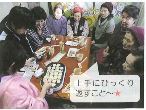
上手にひっくり返すこと~★

七名を中心、に机を囲み、会がスタート。中には、同じ仮設に住みながら、実は初対面という子どもとおばあちゃんも。「あら、上手に焼けたわね」と褒められ、子どもたちはちよつと照れくさそう★始めはぎこちなさがあったものの、「かわいこと、お名前は?何年生?」と質問があったり、「うちの孫が来てるのよ。」とどこか嬉しそうに話すおばあちゃんの姿も。住民のみなさんのあたたかい雰囲気と美味しかったたこやきに、子どもたちの緊張も次第にほぐれていきました。せっかくだけでなく子どもからも「こんなことやあんなことをしてみようよ!」と言ってみよう♪ 地域が子どもたちを育てると同時に、子どもたちが地域を元気にする、これも楽しいまちづくりのひとつではないでしょうか。