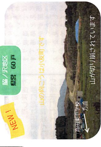
山の向こうは小友町です