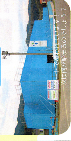
次は何が始まるのでしょうか? 土くぼわれています!