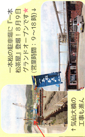
↑気仙大橋の工事も進んでいます

一本松の駐車場に『一本松茶屋』登場! 8月9日グランドオープンです★(営業時間: 9~18時) ↓