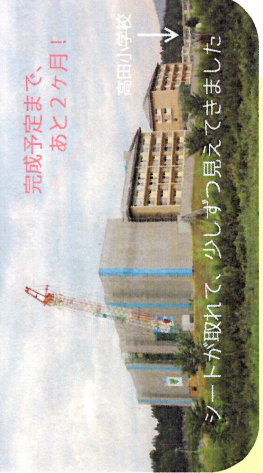
完成予定まで、あと2ヶ月! 高田小学校