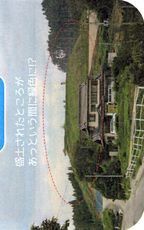
盛土されたところがあつという間に緑色に!

※市のホームページ、復興News 陸前高田、陸前高田市震災復興計画 主要事業ロードマップ、復興庁/つちおと情報館(岩手県)を参照しています。 ※撮影日の天候により、実際の白と異なる場合があります。