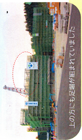
上の方にも足場が組まれています