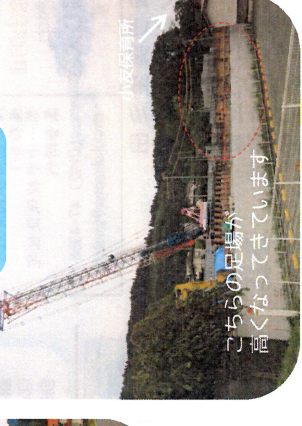
こちらの足場がなくなってきました 小友保育所

以下の予定地は、今後掲載予定です ●長部地区: 市営 30戸 ●田端地区: 市営 14戸