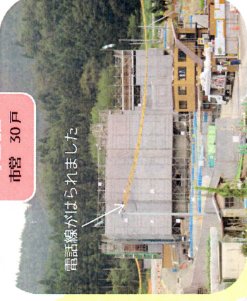
電話線がはられました