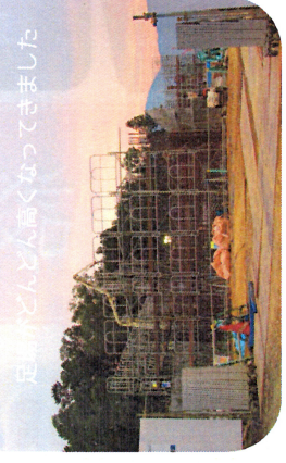
足場ほとんどなくなってきました